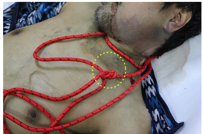
Fig. 3. A slip-knotted (circle) red elastic rope was wrapped around his neck twice. This rope was wrapped around the entire recliner from its back to the leg rest.