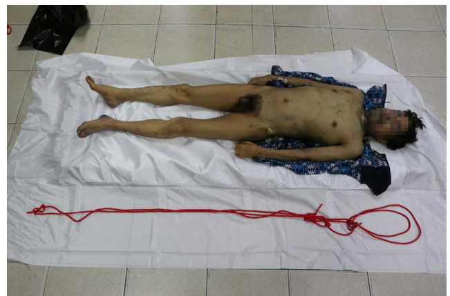
Fig. 4. The deceased and ligature material. The rope was about 0.7 cm thick and about 6 meters long.