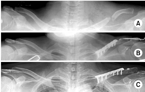
Fig. 1. 55-year-old woman with left clavicle midshaft fracture with ipsilateral acromioclavicular joint dislocation underwent the surgery with reconstruction LCP fixation and coracoclavicular augmentation using Tightrope ® . (A) Preoperative radiograph shows clavicle midshaft fracture with Rockwood type V acromioclavicular joint dislocation. (B) Immediate postoperative radiograph shows successful reduction and fixation. (C) Radiograph at 24 months postoperatively shows united clavicle and no significant loss of reduction of acromioclavicular joint.

측 혈흉이 동반되었다. 단순 방사선 사진에서 간격 (gap)을 동반한 전위된 쇄골 간부 골절이 관찰되었으며, 원위 쇄골 골편의 상방 전위 및 견봉 쇄골 관절 간격이 넓어진 소견을 보였다. 견관절 액와 촬영을 시행하여 원위 쇄골의 후방 전위가 없음을 확인하였고, Rockwood 제5형의 견봉 쇄골 관절 탈구를 동반한 쇄골 간부 골절로 진단하였다 (Fig. 1).