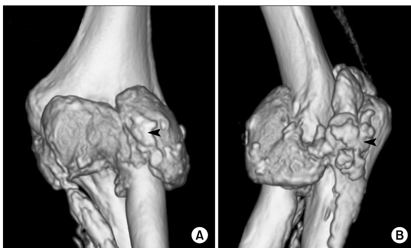
Fig. 2. Computed tomography scan showing nodular calcified deposit in the distal humerus and proximal ulnar and radius (arrow).