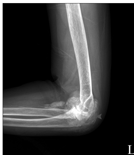
Fig. 1. Plain radiographs show punctate and linear radiopaque deposits in the fibrocartilaginous periarticular joint articular hyaline cartilage (chondrocalcinosis).

foundation의 진단기준에 의거하여 전신성경화증, 류마티스관절염에 동반된 CPPD 결정 침착 질환으로 진단하였다. 비스테로이드 항염제와 프레드니솔론을 투여하고 경과관찰 하였다. 이후에도 환자 증상 크게 호전이 크게 보이지 않아 관절내로 프레드니솔론 40 mg을 주사하였다. 관절주사이후 환자 팔꿈치 관절의 통증 및 부종의 정도와 빈도가 감소되는 소견 보였다. 이후 현재는 정형외과에서 수술적 활막 제거술을 실시하고 호전보이는 양상보이며 경과 관찰 중이다.