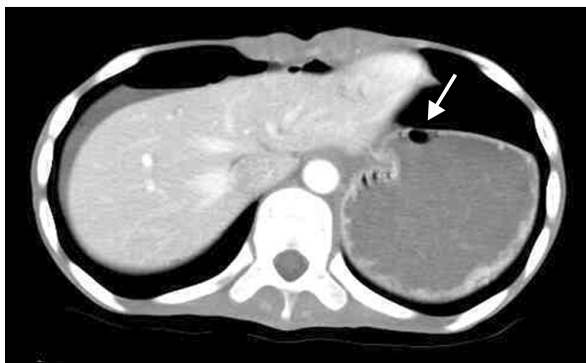
Fig. 2. An abdominal CT scan taken several hours before the operation, revealing marked gastric dilatation with a large volume of food inside the stomach. Air in the gastric wall (arrow) can be seen, as well as free air in the abdomen. The liver appeared atrophic, and mild fatty infiltration was observed.

치료 및 경과: 소아과로 전과 후 시행한 혈액 검사, 복부 방사선 사진과 컴퓨터 단층 촬영 결과 복막염과 이로 인한 과중 혈관내 응고 증후군 의심 하에 다시 외과로 전과되어 응급 수술을 시행하였다. 정신과에서 전과된 후 진단과 응급 수술을 시행하는데 4시간 걸렸다. 수술 후 체중 감소가 더욱 심해져 다시 소아청소년과로 전과 되었으며 이후 영양 공급을 시작하였다. 환아는