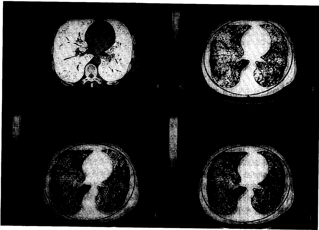
Fig. 2. A. Density mask highlights all voxels with attenuation values less than -400HU representing the lung parenchyma.