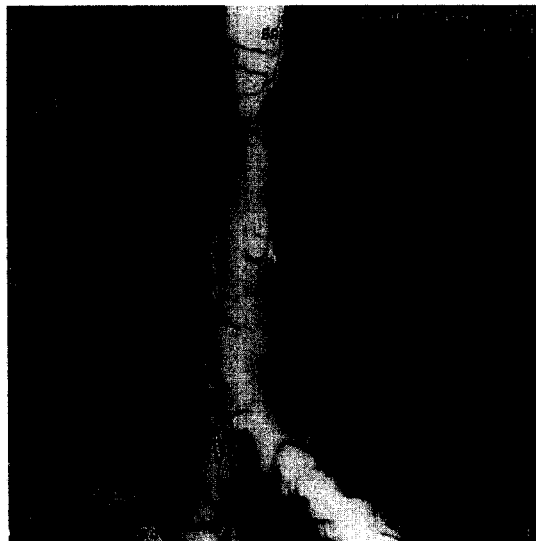
Fig. 1. 3-D CT shows smooth luminal narrowing of about 3cm in length and the most narrowed segment of about 1cm in length.

기관지 내시경검사 소견은 성대 하방 2.5cm 부위부터 육아조직으로 인해 기관의 폐쇄가 불규칙한 동심형 폐쇄소견으로 관찰되었으며 가장 좁아진 부위는 외경 5.9mm 기관지내시경이 통과되지 않았다. 좁아진 부