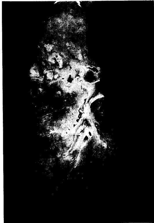
Fig. 4. Right pneumonectomy gross specimen.

모균증은 매우 드문 질환으로 면역이 억제되어 있는 환자나 선행질환이 있는 환자에게 주로 발생하는 기회 감염이다 1 . 백혈병이나 임파종, 당뇨병, 심한 만성질