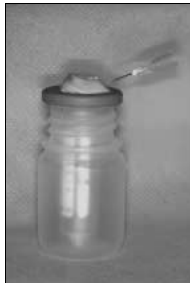
Figure 2. A device for collecting the debris extruded apically