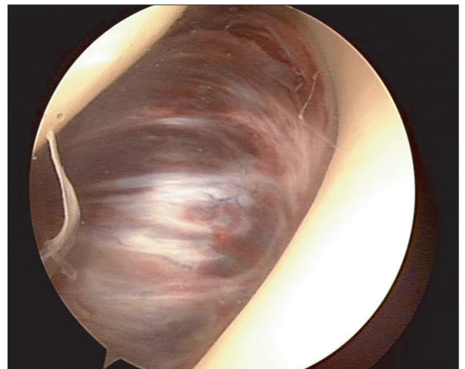
Figure 3. Arthroscopic picture of the mass presents as a single mass measuring 36×30×20 mm in diameter. It has well defined capsule, and varies in color from reddish brown to dark brown.

양성 섬유성 조직구종(cutaneous benign fibrous histiocytoma)과 피하조직, 골격근 및 복강내에 발생하는 심부 양성 섬유성 조직구종(deep benign fibrous histiocytoma)으로 나뉜다. 2-4) 주로 성인의 사지에서 호발하며 피부에서 발생하는 환자의 약 1/3은 다발성이고 무통성의 서서히 자라는 특징이 있으며 임상적으로 표피성 양성 섬유성 조직구종은 섬유 황색종, 황색섬유종, 경화성 혈관종, 건초유래거대세포종양, 양성활막종, 색소성 결절성 활막염, 결절성 건초염등의 다양한 이름으로 혼용되기도 한다. 2-5) 심부 양성 섬유성 조직구종은 모든 양성 섬유성 조직구종의 5% 이하이고 20-40세에 흔하며 남자에 약간 더 많고 하지, 두부, 경부에 호발한다. 3) 모두 고립성이며 관절과는 연결되어 있지 않고 보통의 경우 병변이 무통성으로 증상이 없다. 6) 심부 양성 섬유성 조직구종은 관절 내 병변이 있으므로 특이한 증상을 관찰하기 힘들어 진단이 어려울 수 있다. 2-5,7) 종괴가 관절 안으로 지속적으로 돌출할 경우에는 종종 관절의 퇴행성 변화를 유발하며 관절 연골의 두께 감소와 반응성 골 형성으로 연골하골이 두꺼워지고 골돌 기체 형성 등이 보