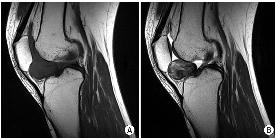
Figure 2. (A) MRI of her right knee. The ovoid mass like lesion in the infrapatellar fat pad area, shows isointense on sagittal SE T1-weighted image. (B) MRI SE T2-weighted image of her right knee. This mass is relatively well defined margin and homogenous signal intensity.

양성 섬유성 조직구종(cutaneous benign fibrous histiocytoma)과 피하조직, 골격근 및 복강내에 발생하는 심부 양성 섬유성 조직구종(deep benign fibrous histiocytoma)으로 나뉜다. 2-4) 주로 성인의 사지에서 호발하며 피부에서 발생하는 환자의 약 1/3은 다발성이고 무통성의 서서히 자라는 특징이 있으며 임상적으로 표피성 양성 섬유성 조직구종은 섬유 황색종, 황색섬유종, 경화성 혈관종, 건초유래거대세포종양, 양성활막종, 색소성 결절성 활막염, 결절성 건초염등의 다양한 이름으로 혼용되기도 한다. 2-5) 심부 양성 섬유성 조직구종은 모든 양성 섬유성 조직구종의 5% 이하이고 20-40세에 흔하며 남자에 약간 더 많고 하지, 두부, 경부에 호발한다. 3) 모두 고립성이며 관절과는 연결되어 있지 않고 보통의 경우 병변이 무통성으로 증상이 없다. 6) 심부 양성 섬유성 조직구종은 관절 내 병변이 있으므로 특이한 증상을 관찰하기 힘들어 진단이 어려울 수 있다. 2-5,7) 종괴가 관절 안으로 지속적으로 돌출할 경우에는 종종 관절의 퇴행성 변화를 유발하며 관절 연골의 두께 감소와 반응성 골 형성으로 연골하골이 두꺼워지고 골돌 기체 형성 등이 보