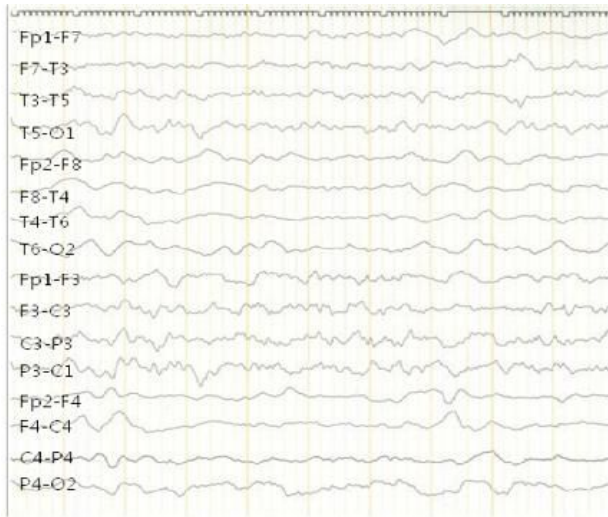
Fig. 3. The electroencephalogram showed an asymmetric background with slow delta activities in the right hemisphere.

내원 4일 혈액 배양 및 뇌척수액 추적 배양 검사 시행하였고 2일 후 결과에서 동정된 균은 없었다. 내원 7일 의식상태는 각성상태로 회복 되었으며, 신경학적 검사 상 양측 동공 반사 및 광반사 정상이었으며, 심전부반사도 정상소견 보였으며, 좌측 바빈스키 징후도 나타나지 않았다. 더 이상의 경련은 보이지 않았으며, 좌측 상하지의 감각소실 소견 또한 회복되었으나, 근력 검사 상 좌측 상하지 근력 저하소견은 Grade III/V로 남아 있었다. 입원 당시 혈액 배양 검사에서 자란 A군 시슬알균의 M 항원형은 유전자 검사 상 emm18 로 밝혀졌고, T 항원형은 확정되지 않는 형(non-typeable)으로 보고 되었다.