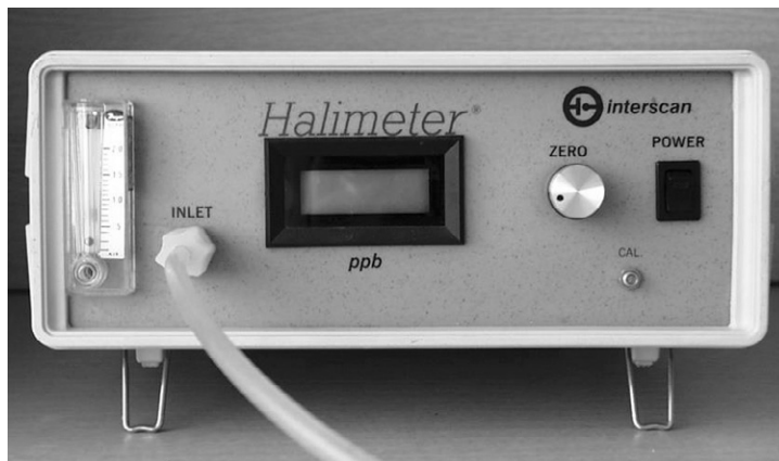
Figure 1. Halimeter (Interscan Co., Chatsworth, CA)

치주질환의 처치와 구취감소와의 상관관계를 보고자 치료 전 특별한 구강 위생 술식은 교육하지 않았으며 환자가 관리하던 방법대로 잇솔질 하도록 지시하였다. 단 휘발성 황 화합물 농도 측정 시 2시간 전부터는 어떠한 구강활동(먹기, 마시기, 씹기, 닦기, 구강양치)도 자제하도록 지시되었다. 또한 인공적인