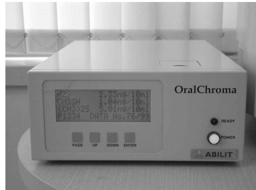
Figure 1. Oral Chroma®(ABILIT Cor. Japan)

시린지의 피스톤을 끝까지 왕복하여 구강 내 가스를 채취하였다. 채취한 가스의 H 2 S 와 CH 3 SH 의 농도를 측정하고 CH 3 SH/H 2 S 의 비율을 구하였다.