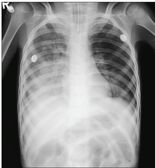
Fig. 2. Chest X-ray film shows pneumonic haziness in right lower lung field on admission day.

치료 및 경과: 기계호흡과 함께 수분 공급, 전해질 교정, 혈당조절, 보온, 항생제 투여 등 보존적 치료를 시작하였다. 초기 탈수소견에 대해 하루 150 mL/kg 수액을