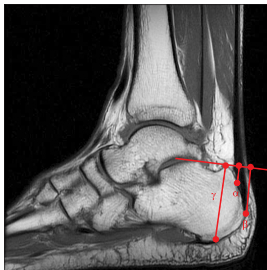
Figure 1. Posterior aspect of calcaneus ( \gamma ), proximal insertion of Achilles tendon ( \alpha ), distal insertion of Achilles tendon ( \beta ) were measured on a midsagittal slice of a T1-weighted ankle magnetic resonance imaging.