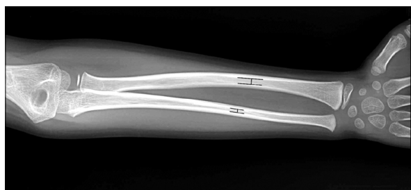
Fig. 1. The lines show the narrowest points of internal diameter in the radius and ulna.