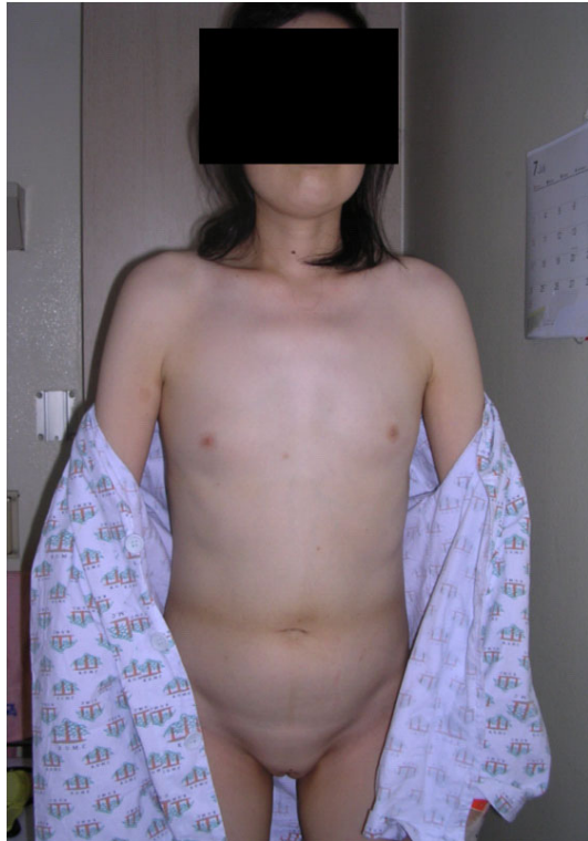
Fig. 1. Patient's appearance. She had an undeveloped breast and no pubic hair.

여 전산화단층촬영을 시행 후, 대장 종양이 의심되어 본원으로 전원되었다.