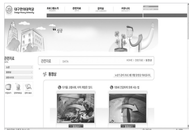
Figure 3. Related data.

관련자료에 대한 세부 메뉴는 노인관련 논문, 프로그램에 삽입된 동영상 자료, 국내에서 개발된 노인관련 웹사이트 14개를 바로 접속할 수 있도록 링크시켰다. 특히 노년기 준비교육과 관련한 동영상 12편은 KBS, EBS, 생활체육협의회, 대한적십자사 등에서 제작한 매체로써 본 웹기반 프로그램의 콘텐츠로 사