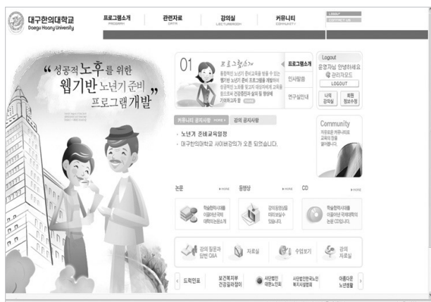
Figure 2. Main page.