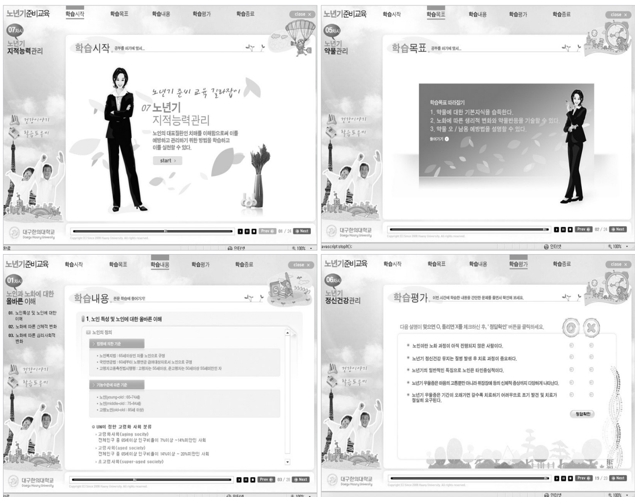
Figure 4. Learning contents.

바를 제작하여 과목소개, 이용방법 및 학습준비사항을 소개하도록 구성하였다. 각 주제의 강의란을 클릭하면 실제 사이버 강의란에 접속이 되며, 모든 주제에 대한 사이버 강의는 학습시작(단원에 대한 간단한 소개), 학습목표(단원별 학습목표 제시), 학습내용(약 30분간의 강의진행), 학습평가(강의내용에 대한 피드백, 관련 동영상 제시), 학습종료(다음 강의내용에 대한 정보제시)의 5개의 일관된 형식으로 구성되었다. 또한 각 주제별 강의에 쉬어가기 코너를 구성하여 건강과 관련한 일화, 시, 이야기 등을 제시하여 사이버 강의의 지루함을 감소시키고자 하였으며, 학습내용에서는 표와 그림 등을 각 화면에 1개씩 제시하여 학습효과를 극대화하였다. 전반적인 콘텐츠 프리젠테이션은 그래픽, 음성, 동영상, 애니메이션 등 다양한 멀티미디어 자료를 사용하여 학습자가 효율적으로 수강할 수 있도록 구성하였다. 또한 매 회 강의내용을 효과적으로 학습할 수 있도록 학습평가를 수행하여 강의내용에 대한 질문에 O, X로 응답하