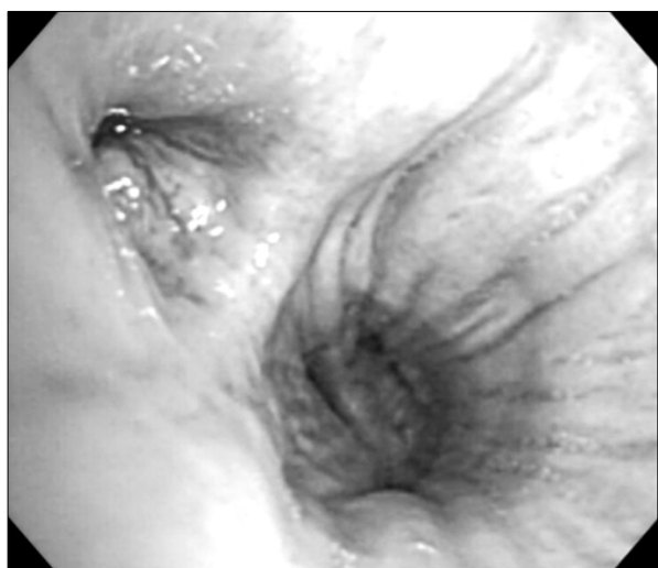
Figure 1. Bronchoscopy shows a small mass obstructing LLL superior segmental bronchus.

검사실 소견: 혈액검사 상 혈색소 10.1 g/dl, 헤마토크리트 31.5%, 백혈구 7,200/mm 3 (임파구 29.9%, 단핵구 8.9%, 중성구 56.1%), 혈소판 319,000/mm 3 였다. 생화학검사 상 BUN 27 mg/dl, 크레아티닌 0.8 mg/dl, 총단백질 4.7 g/dl, 알부민 1.0 g/dl, 중성지방 144 mg/dl, 콜레스테롤 289 mg/dl, AST 54 IU/L, ALT 22 IU/L, LDH 849 U/L 이었다. 요검사항(+++)의 단백뇨, 고배율현미경소견상 다수의 적혈구가 관찰되었다. 24시간 요검사항 12.5