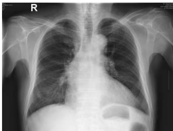
Figure 1. Chest PA showing no active lung lesion except mild cardiomegaly.

방사선 소견 : 단순 흉부 촬영상 심비대 소견 이외에 폐실질의 비정상 소견은 관찰되지 않았다(Figure 1). 진단 및 병리학적 소견 : 기관지내시경 소견상 전기 관지에 걸쳐 경한 탄분 섬유화증(anthraxofibrosis)이 있었고, 우상부 기관지의 뒤쪽 분절 입구에 표면이 매끈하고 하얀 색조를 띠는 1.5x1.5x1 cm 크기의 돌출된 종괴가 관찰되었다. 이 종괴는 집자로 잡았을 때 중등도의 굳기(consistency)를 보였고 움직일 수 있었으며 내시경적 절제술을 시행하였고 출혈은 심하지 않았다(Figure 2). 병리조직학적 소견에서 이 종괴 내부는 섬유혈관다발로 이루어져 있고, 그 표면은 정