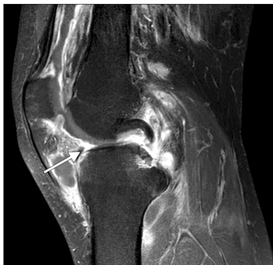
Figure 2. Sagittal T1-weighted enhanced fat-suppressed magnetic resonance image shows synovial thickening with well enhancement and effusion (arrow) in left knee joint; and poorly defined bone marrow signal change in medial femoral condyle and tibial plateau. These findings are consistent with septic arthritis with osteomyelitis.

mycin (1 g 주 5회 근육 주사, 3개월)으로 치료 하였다. 치료 8개월 짜 흉부 방사선 촬영상 좌측 흉수는 감소하였으나(Figure 1B) 좌측 무릎 관절의 통증 및 종창이 새로 발생하였고 관절 천자액 검사에서 백혈구 9,950/\text{mm}^3 (호중구 7%, 림프구 45%), 항산균 도말 양성이었으며 M. intracellulare 가 반복적으로 7회 배양되었고 2회의 동정검사에서 모두 M. intracellulare 로 동정되었다. 자기공명영상에서는 무릎관절의 관절염 및 대퇴골 하부와 경골 상부의 골수염 소견이 관찰되었다(Figure 2). 이후 corticosteroid를 20 mg/day에서 7.5 mg/day로 감량 하고 rifampicin (600 mg/day), ethambutol (800 mg/day), clarithromycin (1,000 mg/day)에 streptomycin (1 g 주 5회 근육 주사, 5개월), moxifloxacin (400 mg/day)을 추가하면서 무릎 관절 종창은 호전되고 관절 천자액 검사에서 백혈구가 감소하였다. 그러나 치료 15개월 짜 좌측 무릎 통증이 악화되어 반복 검사한 관절 천자액에서도 M. intracellulare 가 다시 배양되었다. 이후 관절경을 이용한 활막 절제술을 시행 받았으며 조직 소견상 비특징적인 육아종이 관찰되었으며 AFB염색은 음성이었다. 수술 시 채취한 관절액에서 M. intracellulare 가 동정되었으며 약제 감수성 검사 결과(Sensititre MAISLOW panel; TREK Diagnostic Systems, Cleveland, OH, USA) clarithromycin