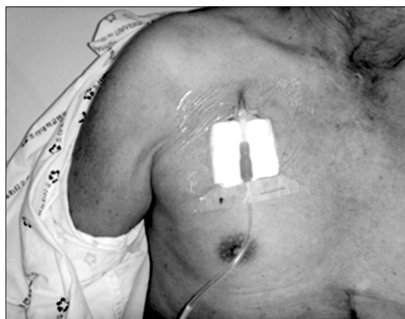
Figure 2. Small caliber catheter is inserted in first intercostal space at right midclavicular line.