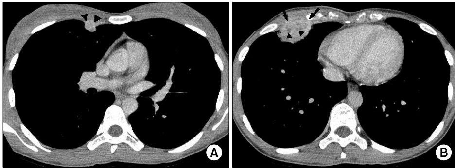
Figure 2. (A) CT scan after intravenous contrast administration at the level of the bronchus intermedius shows an enhancing subpleural nodule (arrowheads) with internal low attenuation in the anterior segment of right upper lobe. (B) CT scan after intravenous contrast administration at the level of left ventricle shows an enhancing subpleural nodule (arrows) with pleural thickening and internal low attenuation (arrowheads).

52일째에 시행한 흉부 X선 검사에서 우중엽에 있던 폐침윤이 현저히 커졌다. 내원 시에 시행한 결핵균 배양검사는 음성이었다. 촬영두께는 0.625 mm, 관전압은 120 KV, 전류는 50 mA를 촬영조건으로 하고 120 mL의 아이오메프로(Imeprol, Ilsung Pharmaceuticals Co., Seoul, Korea)를 사용하여 저선량 조영 증강 CT (low dose enhanced CT)를 얻었다. 저선량 조영 증강 CT에서 우상엽 후분절에 있던 원발 병소는 완전히 소실되었다. 그러나 과사에 의한 저음영이 내부에 있고 조영 증강이 잘되는 결절들이 우상엽의 전분절(13×13 mm)과 우중엽(41×35 mm)의 폐 주변부에 보였다(Figure 2). 같은 날 확진을 위해 초음파 유도 하에 자동총 생검(ultrasound guided biopsy specimen)을 우중엽 결절에서 시행하였다. 병리 진단은 건락괴사(caseation necrosis)가 동반된 육아종으로 결핵과 합당한 소견을 보였다. 생검 조직을 사용한 결핵균 도말과 배양검사는 음성이었다. 임상경과와 병리소견을 종합하여 폐결핵의 치료중에 발생한 일시적인 방사선학적인 악화로 확진하였다. 처음에 사용하였던 항결핵제들을 12개월 간 유지하였고 추적검사로 시행한 흉부 X선 검사에서 우중엽에 있던 결절의 크기가 현저히 감소한 것을 확인하였다.