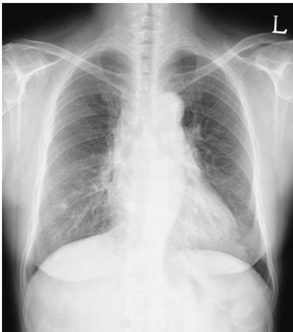
Figure 3. After steroid and cyclophosphamide treatment, Diffuse ground glass attenuation in both lungs are more improved.

예후는 베게너 육아종증이나 microscopic polyangiitis 등의 ANCA 관련 혈관염에 비해서 고용량의 스테로이드나 면역 억제제에 반응이 좋아 예후는 좋을 것으로 되어 있다. 그리고 임상적 호전과 함께 대개 ANCA의 titer도 떨어지는 것으로 되어있으나 ANCA 양성 소견이 지속시 다시 재발 가능성이 있어 지속적인 관찰이 필요하다고 한다 15 . 본 증례에서 환자는 고용량 스테로이드 치료 및 cyclophosphamide 치료 후 환자의 호흡 곤란 증상은 호전되었으며 흉부 x-선상 보이던 음영 증가 소견도 호전되었다(Fig. 3). 6개월 후 다시 시행한 ANCA 추적 검사상 ANCA는 계속 양성 소견 보이고 있으나 특별히 재발 등의 증후는 보이지 않고 있어 외래 추적관찰 중이다.