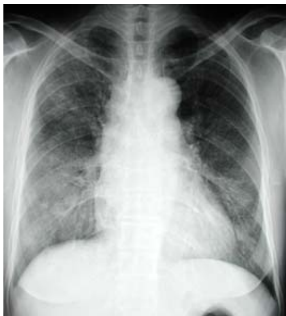
Figure 1. Chest X ray showing diffuse airspace opacity in both lower lungs.

83.7 fL, MCH 26.9 pg, MCHC 32.2 g/dl), 적혈구 용적율 20.5%, 혈소판 242,000/uL, 백혈구는 4600/uL 였으며, 말초혈액도말 검사상 저색소, 소적혈구 빈혈 (hypochromic microcytic anemia) 소견 관찰되었다. 혈청내 철농도, 총철결합능, ferritin은 각각 15.4ug/dL, 371ug/Dl, 92ug/ml 였다. 적혈구 침강율은 140 mm/hr으로 상승되어 있었으며, CRP도 27.7 mg/L 으로 상승되어 있었다. 내원시 시행한 동맥혈 검사상 pH 7.4, 이산화탄소분압 33mmHg, 산소분압 81 mmHg, 중탄산염 25mmol/L, 산소포화도 95% 관찰 되었다. 전해질 검사, 간기능 검사 등 혈청 생화학 검사상 이상 소견은 없었다. 요화학 검사상 pH 5.5, 적혈구 10-29/HPF, 단백 1+/HPF, 비전형 적혈구 (dysmorphic RBC) 20%였다. 24시간 소변 검사상 단백 430mg/24hour, Ccr은 54ml/minute 였다. 갑상선 기능 검사상 Free T4 1.5 uIU/ml (0.78~1.70 uIU/ml), TSH 1.7ng/ml (0.17~4.05ng/ml) 였다. 그리고 thyroglobulin Ab(+), anti-microsomal Ab(+ ) 였다. 면역 혈청 검사상 rheumatoid factor는 음성 이었으나 FANA가 1:320 의 양성(speckled type) 소견을 보였고, C3/C4는 정상 수치를 보였다. anti ds DNA Ab(-), anti Smith Ab(-), anti SS-A