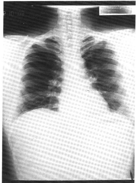
Figure 1. Chest X-ray Findings. Left(the first visit) : bilateral ground-glass opacities are noticed. Right(cure state) : nearly normalized.