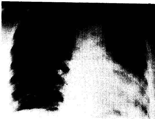
Fig. 4. Chest radiograph after intratumoral absolute alcohol injection reveals fully expanded left lung.

이 호전되었고 청진상 호흡음이 증가되었다. 폐기능 검사상 FVC 2.70L(예측치의 82%) FEV 1 1.76L(예측치의 67%)로 약간의 폐쇄성 환기장애의 소견을 나타내었다. 그후 15일째 좌측주기관지의 육아종에 의한 폐쇄소견이 다시 재발하였고, 모 병원에서 좌측 폐절제술을 시행하였다.