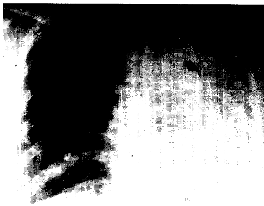
Fig. 1. Initial chest radiograph shows total collapse of the left lung and self expandible metallic stent (arrow) in the left main bronchus.

내원 5일째 실시한 기관지경상 좌측 주기관지 하방에 돌출된 조직(polypoid mass)으로 인하여 완전