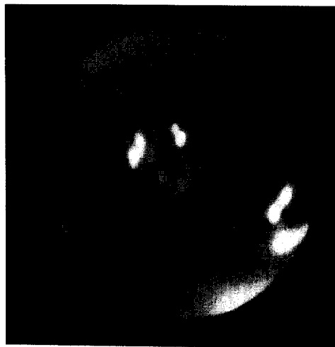
Fig. 2. Initial bronchoscopic photograph demonstrates well margined, polypoid mass and total obstruction of the left main bronchus.