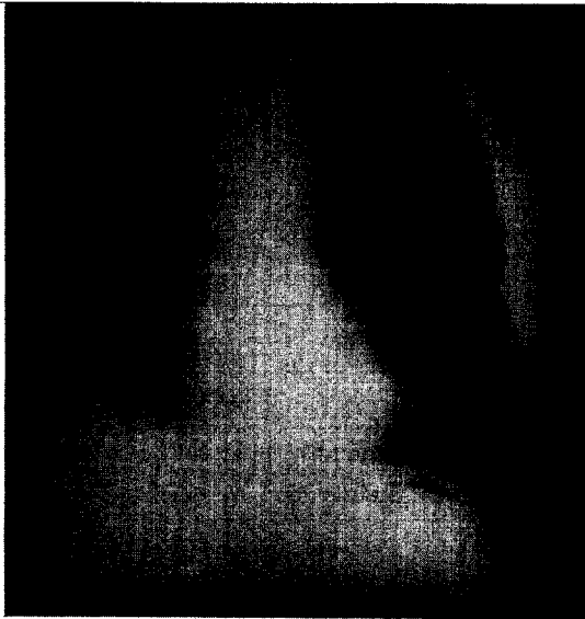
Fig. 1B. Chest PA shows an approximate 9×6cm sized lobulated huge mass with increased opacity in the right upper lung field.