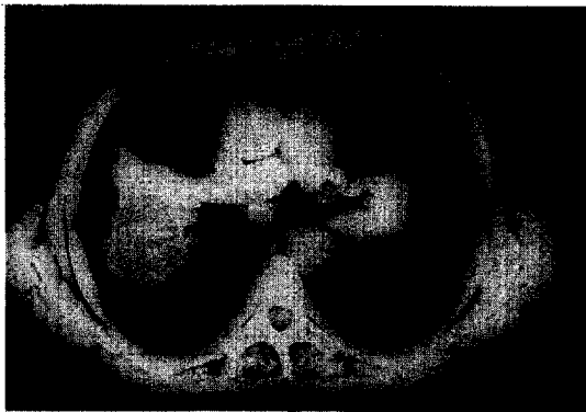
Fig. 2. Mediastinal window setting shows non-enhancing ovoid structure wrapped up thin membrane in the right lung.

의 저류로 단기간내에 크기가 증가된 진행성 종괴성 섬유증 치료 및 경과: 호흡곤란에 대하여 기관지확장제 투여와 보존적 치료를 시행한 결과 환자상태가 좋아져 퇴원하였다.