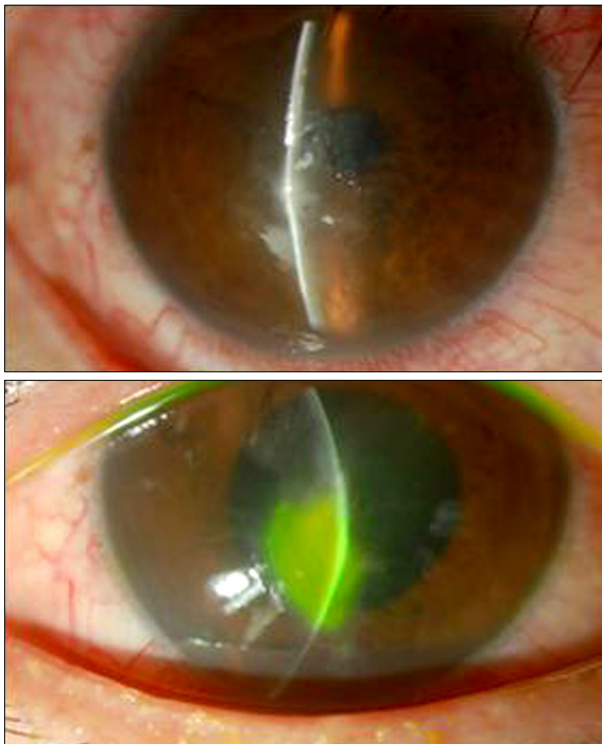
Figure 2. Post-therapeutic photographs (3 days).

손 및 기질 침윤이 보이지 않았으며 안정된 상태가 유지되었다(Fig. 3). 앞방에 염증반응 및 출혈과 동반된 안구통증도 없었다.