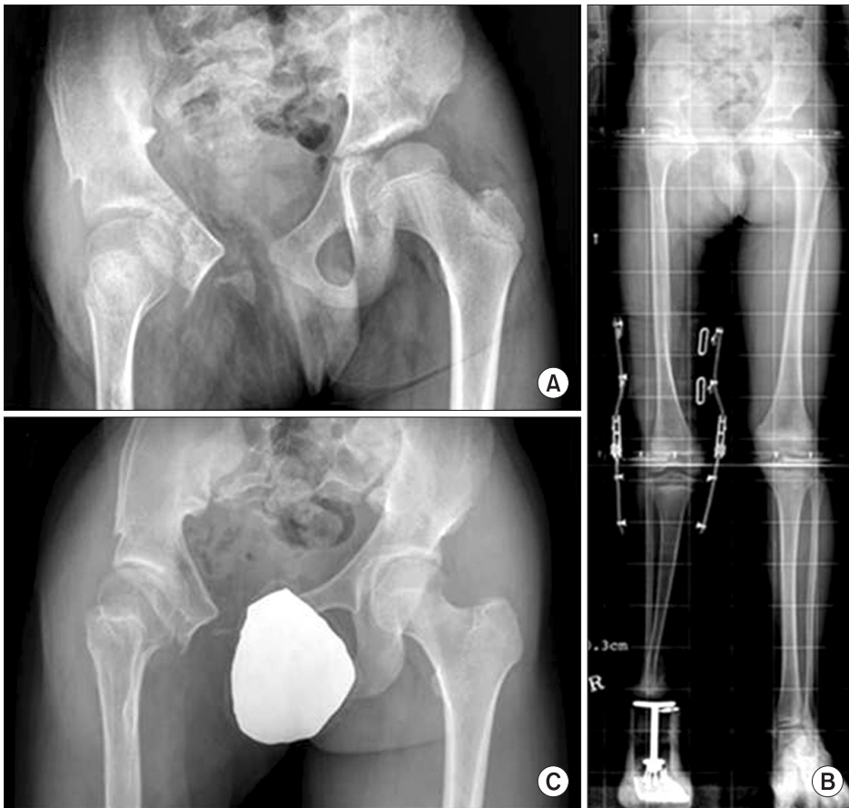
Figure 3. (A) Plain radiograph taken at 11 years of age shows good acetabular coverage and joint congruency in both hip joints. (B) The radiograph included both weight bearing whole lower limbs taken at 11 years of age. Extension-block knee brace and syme amputation prosthesis are shown. (C) The latest follow-up radiograph taken at 18 years of age.