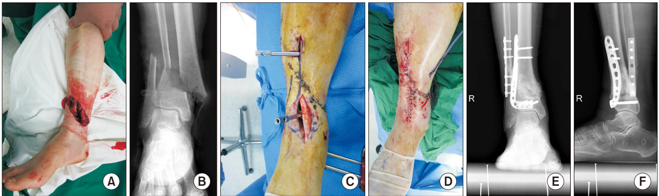
Figure 2. (A) A 49-year-old female was sustained painful swelling and an open wound on the medial side of the right ankle due to a traffic accident. The fracture site of the distal tibia, which was a type IIIA open fracture, was exposed. (B) Plain radiographs of the right ankle showed a distal tibial fracture of AO type A1 [AO Foundation/Orthopaedic Trauma Association classification]. (C) After the damage control by temporary external fixator, anterolateral plate was inserted through minimal anterior approach minimally invasive plate osteosynthesis (MIPO) technique. (D) Photograph after wound closure. Because anterolateral MIPO was performed, wound problems could be avoided. At postoperative 1-year, ankle anteroposterior (E) and lateral (F) plain radiographs show a bony union of the fracture site with callus formation.