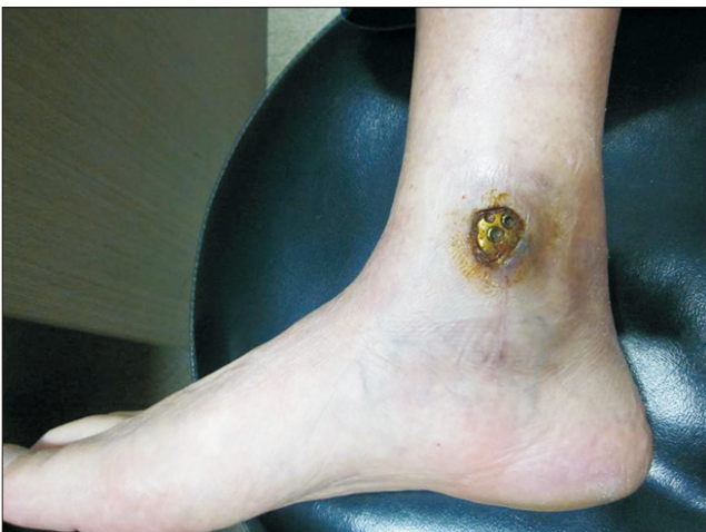
Figure 3. The medial locking plate was exposed on medial side of the ankle.

혈류 및 혈종을 보존하여 좋은 임상적 결과들을 보고하고 있다. 5-9) 하지만 경골의 내측은 피하 연부조직이 적어 특히 내과골 부위에서 금속판으로 인한 피부 자극증상 등의 불편감을 줄 수 있고 심한 경우 골유합을 얻은 후 금속 제거술이 필요할 수 있으며 내측부에 연부조직의 손상이 심한 경우 수술 후 피부괴사 및 금속판 노출 등의 합병증을 초래할 수 있다(Fig. 3). 8,10-12) 또한 내측 최소 침습적 금속판 고정술로는 관절 내 골절을 정복하기는 어렵다.