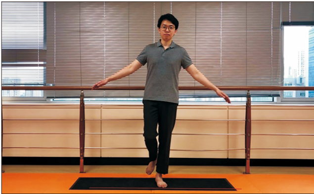
Figure 1. Measuring center of pressure (open eyes).

눈을 감았을 때 211.4 \pm 129.9 \text{ mm}^2 이었으며 건측의 압력 중심의 타원 영역은 눈을 떴을 때는 56.1 \pm 35.6 \text{ mm}^2 , 눈을 감았을 때 234.4 \pm 202.6 \text{ mm}^2 으로 나타났다. FAOS의 각 세부 항목은 통증 72.8, 증상 80, 기능 87.5, 스포츠 58.9, 삶의 질 42.9로 평균 68.42점이었다. 이에 대해 상관계수를 평가하였고 눈을 떴을 때 환측의 이동거리는 FAOS의 통증 항목에 대해 -0.394 ( p=0.038 ), 전체 평균 점수에 대해 -0.429 ( p=0.023 )였으며 타원 영역은 삶의 질 항목에서 -0.425 ( p=0.024 )의 유의한 음의 상관관계를 보였다(Table 2, Fig. 4). 반면, 눈을 감았을 때 측정된 압력 중심의 이동거리, 타원 영역은 환측에서 유의한 상관관계를 보이지 않았다( p>0.05 ).