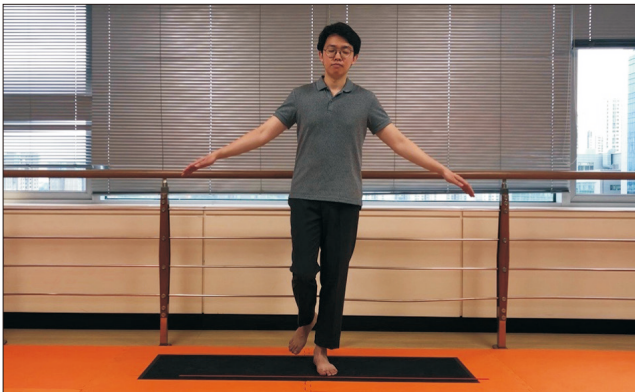
Figure 2. Measuring center of pressure (closed eyes).