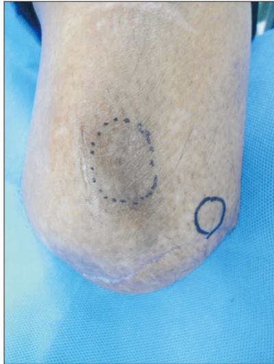
Figure 1. Preoperative photograph shows blue circle marked amputee end marked with Tinel's sign.

측에 대해 신경종으로 의심되는 선상의 조직에 대해 박리 후 근육 속에 매몰시켰다(Fig. 2). 수술 후 외측에 대해 환자의 증상은 호전되었으나 전측의 증상은 호전되지 않았으며 여전히 티넬 징후 양성 소견을 보였다. 술 후 다시 약 1년 동안 보조기 소켓의 교정, 약물 치료