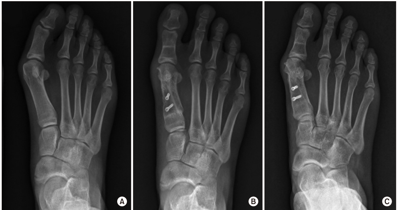
Figure 2. Standing anteroposterior radiographs of recurrent hallux valgus case in a 15-year-old female foot shows (A) preoperative, (B) postoperative 2 months, and (C) postoperative 3 years follow-up. Hallux valgus angle (HVA) and intermetatarsal angle (IMA) well corrected. However, postoperative distal metatarsal articular angle (DMAA) was 13.9 degree. At last follow-up, hallux valgus recurred with HVA 28.2 degrees.

경우 재발과 연관성이 있음을 입증하였다. 본 연구의 저자들은 수술 전 원위 중족골 관절면각이 큰 경우 scarf 및 Akin 절골술 후에 교정이 적절히 이루어지지 못할 경우 무지외반증 재발의 가능성이 높음을 경험한 바 있다(Fig. 2, 3). 그러므로 수술 전 영상에서 원위 중족골 관절면각을 포함한 자세한 방사선학적 평가가 이루어져 이에 대한 교정을 시행하는 것이 재발을 줄일 수 있는 방법이 될 것으로 생각된다.