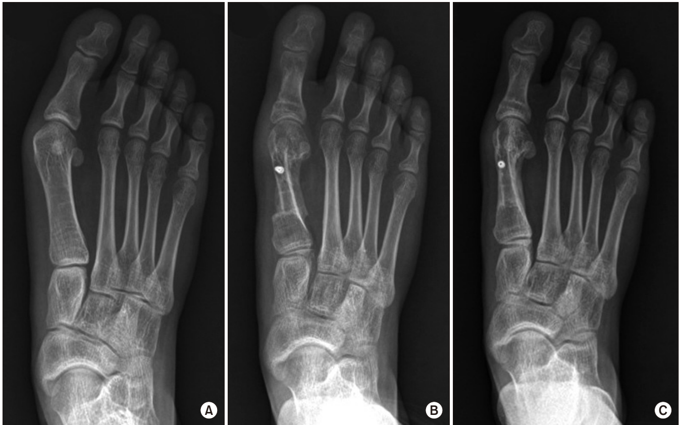
Figure 3. Standing anteroposterior radiographs of no recurrent hallux valgus case in a 19-year-old female foot shows (A) preoperative, (B) postoperative 2 months, and (C) postoperative 2 years follow-up. Hallux valgus angle (HVA) and intermetatarsal angle (IMA) well corrected. Postoperative distal metatarsal articular angle [DMAA] was 7.1 degree. At last follow-up, the foot showed no recurrence with HVA 10 degrees.

한편 본 연구는 위험인자들의 재발 예측력을 ROC 곡선 및 AUC를 통해 분석한 연구로 AUC가 0.5 이상일 시 통계적으로 의미가 있으나 0.7 이상일 시 위험인자의 예측력을 fair 이상으로 평가할 수 있으므로 최소 증례 수로서 각 10예 이상의 재발군 및 비재발군이 필요했다. 25) 본 연구에서는 재발군이 11예, 비재발군이 111예였으므로 ROC 곡선을 통해 의미 있는 AUC값을 구할 수 있었다.