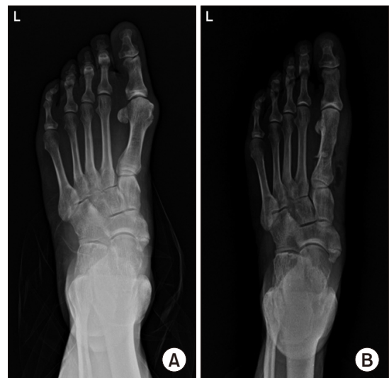
Figure 4. 76-year-old male hallux valgus deformity patient shows hallux valgus angle 36° and intermetatarsal angle 14° in preoperation (A) and after 1 month hallux valgus angle 11° and intermetatarsal angle 6° in postoperation (B).