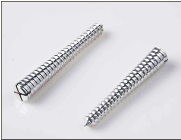
Figure 1. Bioabsorbable headless screw (K-MET™; U&I Corporation).