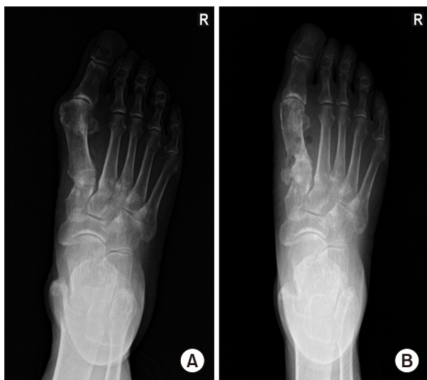
Figure 2. A 73-year-old male hallux valgus deformity patient shows hallux valgus angle 38° and intermetatarsal angle 15° in preoperation (A) and after 1 month hallux valgus angle 15° and intermetatarsal angle 7° in postoperation (B).

로 역 V자 형태의 절골술을 시행한다. 이후 원위부 골편을 내측 및 내회전시키고 원발성 중족 내전증을 교정하고 생체 흡수성 나사못 (K-MET™)을 위한 guide pin을 근위부 골편의 족배 쪽에서 원위부 골편의 족저쪽을 향해, 내측에서 외측을 향하여 삽입하여 갈매기 절골선에 가능한 수직을 이룰 수 있도록 고정한다. 또 다른 guide pin을 이용하여 근위부 골편의 족저 쪽에서 원위부 골편의 족배 쪽을 향해, 내측에서 외측을 향하여 삽입하여 갈매기 절골선에 가능한 한 수직을 이룰 수 있도록 고정한다(Fig. 5). 이후 유관나사 고정 법과 동일하게 확공 후 길이를 잰 후 생체 흡수성 나사못을 고정한다.