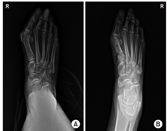
Figure 3. A 80-year-old female hallux valgus deformity patient shows hallux valgus angle 51° and intermetatarsal angle 16° in preoperation (A) and after 1 month hallux valgus angle 25° and intermetatarsal angle 9° in postoperation (B).

로 역 V자 형태의 절골술을 시행한다. 이후 원위부 골편을 내측 및 내회전시키고 원발성 중족 내전증을 교정하고 생체 흡수성 나사못 (K-MET™)을 위한 guide pin을 근위부 골편의 족배 쪽에서 원위부 골편의 족저쪽을 향해, 내측에서 외측을 향하여 삽입하여 갈매기 절골선에 가능한 수직을 이룰 수 있도록 고정한다. 또 다른 guide pin을 이용하여 근위부 골편의 족저 쪽에서 원위부 골편의 족배 쪽을 향해, 내측에서 외측을 향하여 삽입하여 갈매기 절골선에 가능한 한 수직을 이룰 수 있도록 고정한다(Fig. 5). 이후 유관나사 고정 법과 동일하게 확공 후 길이를 잰 후 생체 흡수성 나사못을 고정한다.