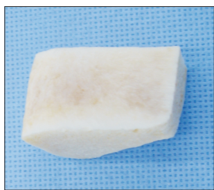
Figure 3. Tricortical-allobone graft.

가 심한 종골 골절에서 Ollier 접근법을 이용한 나사못 고정만으로 골절을 정복하고 고정하여 치료할 수 있었던 것은 삼면 피질골 이식의 역할이 컸을 것으로 추정된다. 또한 동종골을 썰기 모양으로 잘라 겹쳐 쌓으면 작은 절개에도 불구하고 충분한 이식골로 후방 관절면을 버틸 수 있어 정복 유지의 질적 개선에 도움이 된다고 판단된다.