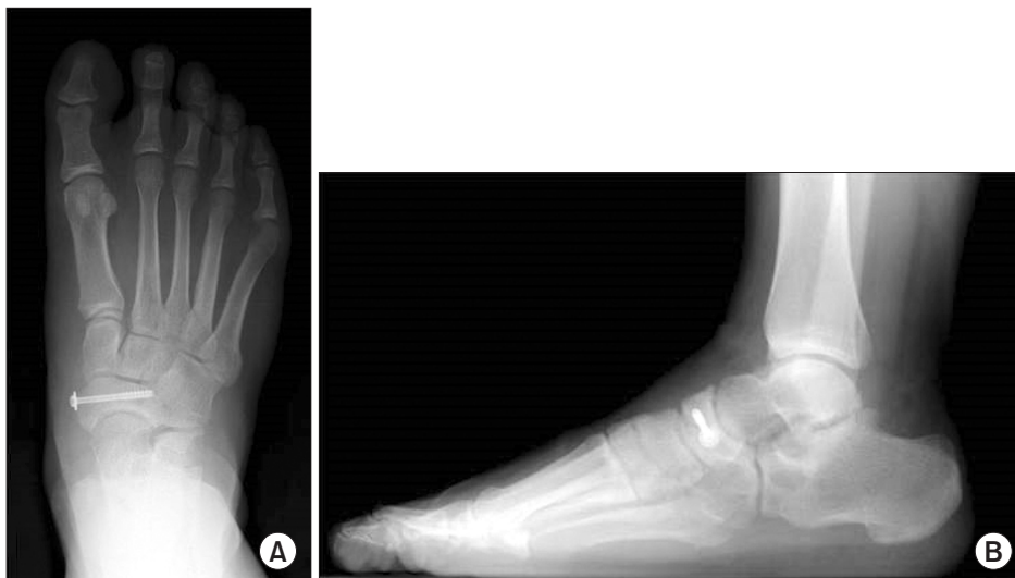
Figure 3. Navicular bone fixated with a cannulated screw through medial to lateral side is observed in postoperative foot standing anteroposterior view (A) and lateral view (B).

주상골 피로 골절은 1970년 Towne 등 1) 이 2예의 증례를 발표한 이후 여러 저자들이 이 질환에 대해 보고하였다. 주로 운동을 많이 하는 일반인, 젊은 남성 운동선수에게 발생하는 질환으로 달리기, 미식 축구, 축구 선수 등에서 높은 유병률을 보이고 있다. 2,4) 발생 빈도가 높은 운동의 성격 및 해부학적 특성을 고려할 때 비교적 혈