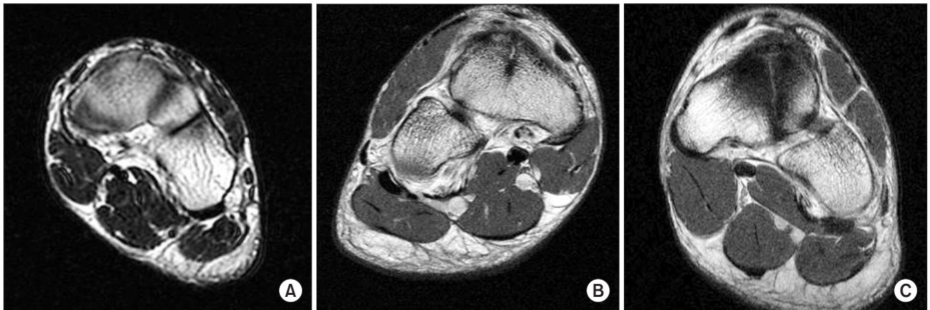
Figure 1. Magnetic resonance images are demonstrating type I navicular stress fracture (A), type II navicular stress fracture (B), and type III navicular stress fracture (C).

주상골 배부에 약 2 cm의 족부 종축에 평행한 절개를 한 후 신경 혈관 구조물을 내측, 신전건을 외측으로 견인한 후 골절 부위를 육안으로 관찰하였다. 경화성 변화가 있거나 피질골이 융기된 곳을 피로 골절 부위로 의심하고 탐침 천자를 시도하였다. 탐침이 인접 피질골보다 쉽게 삽입된 경우 골절 부위로 의심하였으며 C자형 영상 증폭 장치를 이용하여 확인하였다. 경화성 변화가 심한 경우, 일부 절제한 후 종골 전방돌기에서 동일 크기의 자가골(block bone)을 채취하여 이식하였다(Fig. 2). 정복 검사(reduction