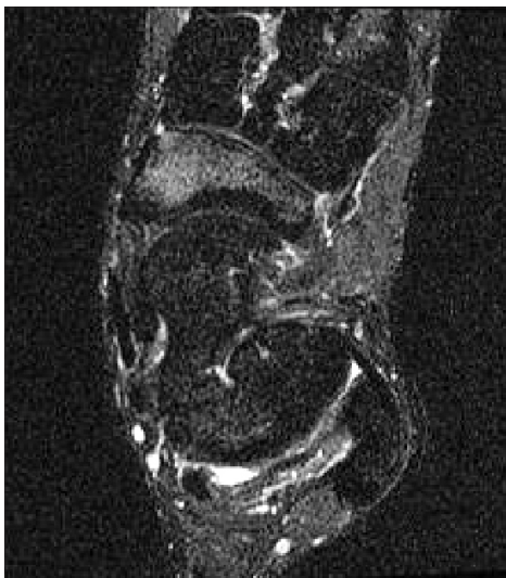
Figure 4. Diffuse high signal over the navicular bone and ambiguous fracture line is observed.

Values are presented as number only or number (%).