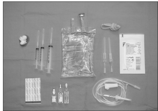
Fig. 2. Items for intravenous sedation. alcohol sponge, 3 cc/5 cc/10 cc Syringe, 500 ml Hartman solution (CJ, Korea), tourniquet, 20G/22G intravenous catheter, Tegaderm 6 × 7 cm (3M, Germany), band, 5 mg/15 mg Dormicum (Roche, Swiss), 0.5 mg Flunil (BooKwang, Korea), infusion set.

을 위주로 진정요법을 시행하지 않을 때의 치과치료 시보다 시간이 많이 걸릴 수도 있음을 미리 환자에게 주지시켜 놓아야 한다.