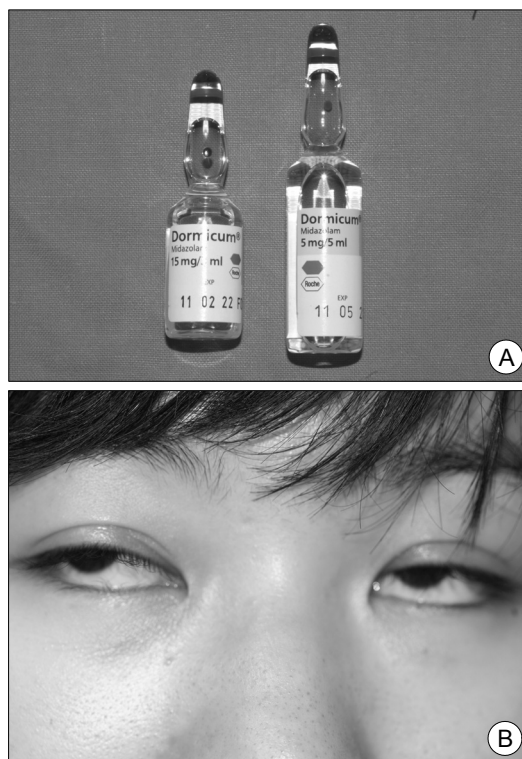
Fig. 5. (A) Midazolam (Dormicum ® ) 5 mg/5 ml is better than 15 mg/3 ml for slow infusion. (B) Verill sign.

이제 미다졸람 2-3 mg을 2분에 걸쳐 서서히 주입한다. 손목시계를 보면서 2분을 확인하도록 하는 것이 좋은데 의외로 쉽지 않음을 알 수 있을 것이다. 미다졸람 15 mg/3 ml 제품보다는 5 mg/5 ml 제품이 서서히 주입하기 위해서는 더 좋다. 환자와 대화를 하면서 미다졸람을 천천히 주입하다 보면 환자의 말이 확연히 느려지는 것을 확인할 수 있을 것이다(Fig. 5).