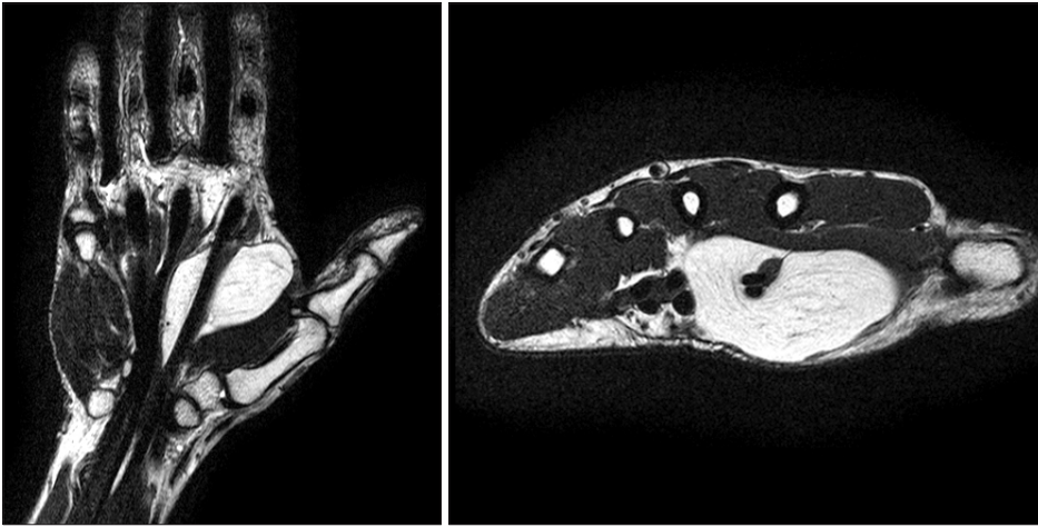
Figure 2. The MRI shows that the tumor is homogenous appearance suggestive of a benign lipoma.