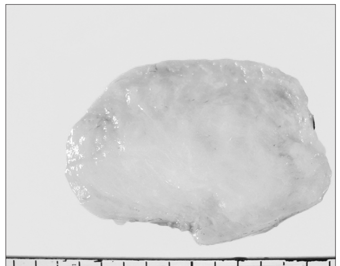
Figure 4. The specimen was examined histologically, the tumor was benign lipoma.

지방종은 피하층, 근육내, 근육간에 발생하는 양성 연부조직 종양이다. 2) 지방종은 크기가 증가하면서 주위 구조를 압박하여 증상을 유발하기도 한다. 이 중 수부에 발생하는 지방종은 전체 지방종의 5%로 드물다. 대개 피하층에서 발생하는데 근육하층에 발생하