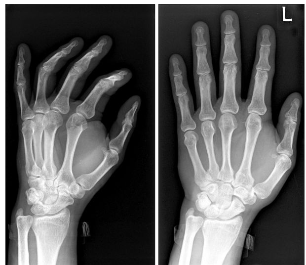
Figure 1. Plain radiographs demonstrate a large mass in the 1st, 2nd web space.

환자는 크기가 증가되는 종괴로 인해 통증을 느끼고 손을 쓰는 데 불편감을 느껴 전신 마취 하중과 적출술을 시행하였다. 종괴는 장수무지굴근과 세번째 수지의 표재지굴근 및 심수지굴근 사이