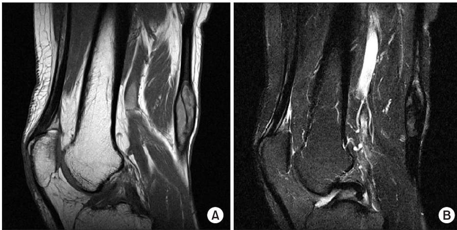
Figure 2. Magnetic resonance images shows well-defined soft tissue mass along semitendinosus tendon, posterior aspect of distal thigh. (A) T1-weighted image: slightly high signal intensity (B) T2-weighted image: heterogeneous iso signal intensity.