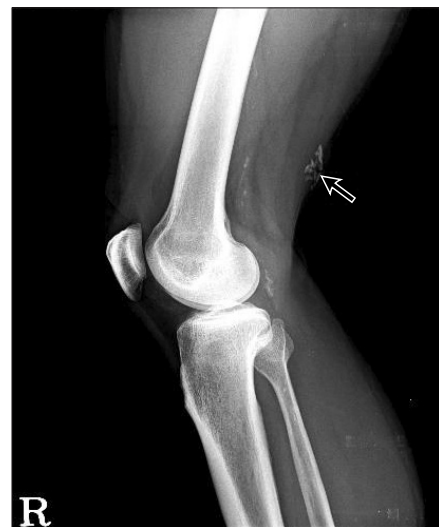
Figure 1. Lateral radiograph of right knee show calcified lesion (arrow) on posterior area of distal femur.

66세 남자 환자로서 내원 8년 전 심하게 넘어진 적이 있고 그 후 잘 지내다 우연히 촉진된 우측 무릎 뒤쪽에 종괴를 주소로 내원