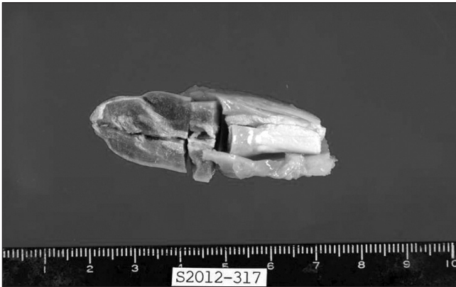
Figure 3. Gross examination reveals tendon (right white portion) with skeletal muscles (left cut view).

signal intensity를 보였다. T1WI와 T2WI 모두에서 동일한 두께의 가장자리에 dark signal intensity rim을 가지고 있고 내부에도 dark signal intensity focus가 보이는데 이는 단순 방사선 사진과 연계하여 비교시 석회화로 진단되었다(Fig. 2). 조영제 검사에선 특이소견은 없었다. 이 종괴와 인접한 부위에 특이소견은 없었다. 환자는 척추마취 하에 복와위 자세로 수술을 받았는데, 수술 소견은 우측 무릎 슬와부 6 cm 상방에 1.6×1.5×5.1 cm 크기의 종괴가 순수 반건양건 내에 위치해 있었으며, 주위 조직으로의 침범은 없었다. 수술은 단순 종괴 부위 절제술을 시행하였고, 술후 다음날부터 체중부하 보행 및 관절운동을 시행하였다. 병리학 교실에서 시행한 육안적 소견(Fig. 3) 현미경하 조직 검사에선 건 내부에 석회화 및 퇴행성 변화가 보이고, 근육 경색이 동반된 골격근육 조직을 관찰할 수 있었다(Fig. 4).