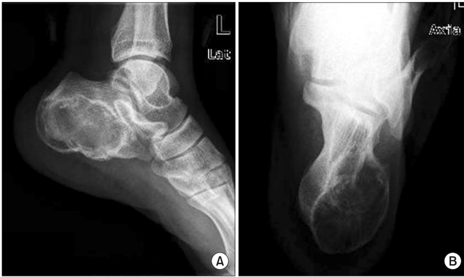
Figure 1. (A) Lateral preoperative radiograph of the left calcaneus revealed osteolytic lesion with thin sclerotic cortex and internal ground glass opacity at posterior and plantar aspect. (B) Axial preoperative radiograph showed osteolytic lesion mainly at medial aspect of calcaneus.