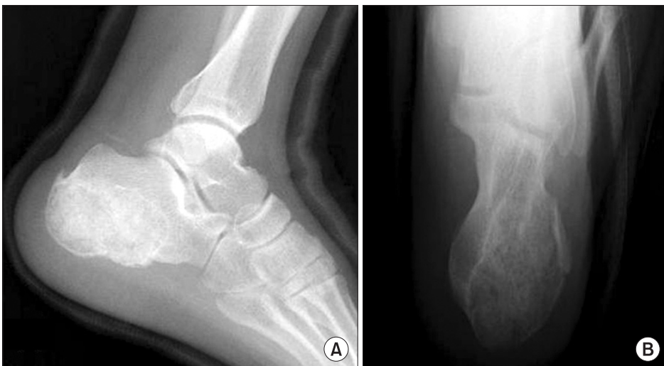
Figure 3. Postoperative radiograph showed the osteolytic lesion filled with grated bone.