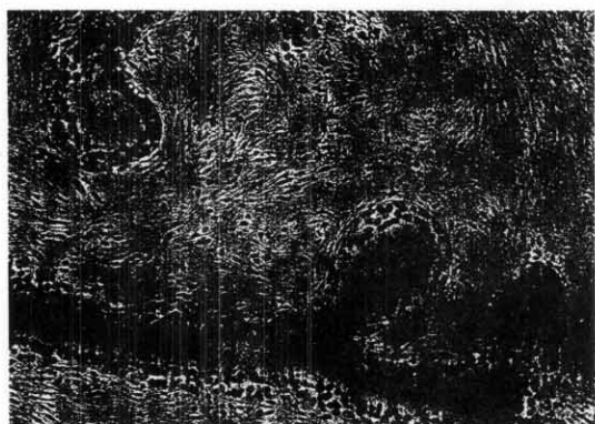
Fig. 1. In fibrocystic disease, ER positive cells arranged evenly in 1 to 2 layers along the duct ( \times 200 ).