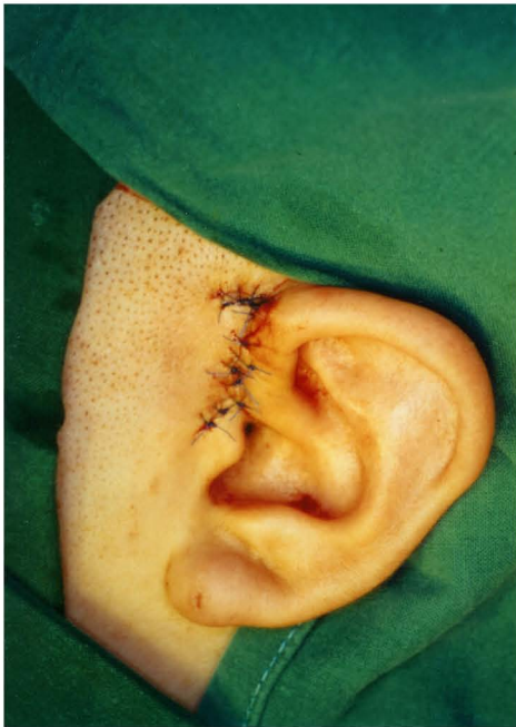
Fig. 1. Inverted L-shaped incision.