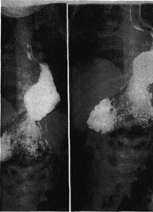
Fig. 1. Preoperative UGI study shows sliding hiatal hernia of the lower esophagus and the gastric fundus.