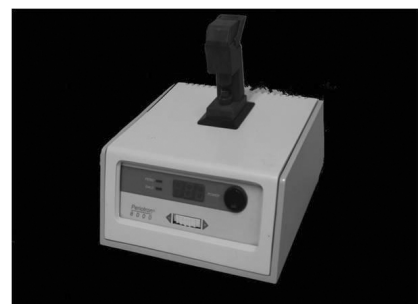
Figure 4. Periotron ® 8000 (Oraflow ® Inc., New York, USA)