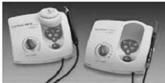
Figure 1. Cavitron JET Plus ® (Dentsply, Philadelphia, USA)

초음파 치석제거는 Cavitron JET Plus ® (Dentsply, USA)를 이용하여 blue zone의 maximum 상태로 하여 적용하였다(Fig. 1).