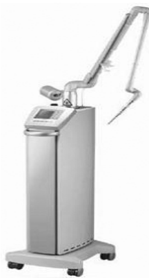
Figure 2. Spectra DENTATM(Lutronic ® , Goyang, Koera)

레이저는 Spectra DENTATM(Lutronic ® , Goyang, Koera) CO 2 레이저를 이용하였다(Fig. 2). 직경 0.5 mm의 needle tip을 이용하여 열구 내에 삽입하여 직접 조사하였으며 이때의 출력은 MTT assay 결과에 따라 30 Hz, 150 µsec으로 조사하였다. 조사는 각 치아의 치면을 협·설면과 근심, 원심으로 나누어 각각 15초씩 총 60초를 조사하였다. 이 모드시의 출력은 0.23 watt, 0.15 mJ이었다(Fig. 3).