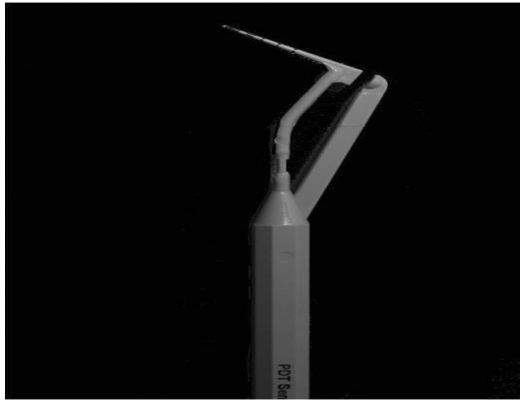
Figure 3. Force controlled probe(Jeil Corp. ® , Gwangju, Koera)

이 연구를 위하여 시작시, 실험 후 1주, 2주, 4주, 8주에 치주낭 탐침 깊이, 임상부착수준, 치은지수, 치은열구지수 및 치은열구삼출액(gingival crevicular fluid level, GCF level)을 측정하였다. 치주낭 탐침 깊이, 임상부착수준, 치은지수, 치은열구지수는 객관적인 평가를 위해 일정한 힘(25g)이 가해지도록 고안된 탐침을 이용하여 측정하였으며 치주낭 탐침시에는 가까운 쪽의 눈금으로 읽었다(Fig. 3).