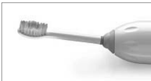
Figure 1. Sonicare Elite® power toothbrush

칫솔질 시 두 군 모두 2080 치약®(애경, 한국)을 사용하였으며, 실험기간 동안은 다른 보조적 구강위생용품(치실, 치간 칫솔, 수압 청정기, 양치액 등)의 사용을 금하였다.