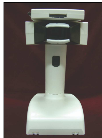
Fig. 2. ShadePilot™ dental spectrophotometer (DeguDent GmbH, Rodenbacher, Germany).