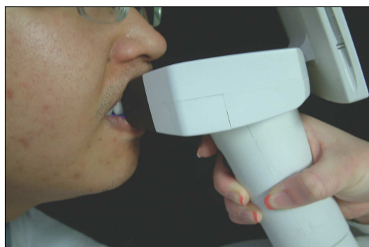
Fig. 4. Measuring process.