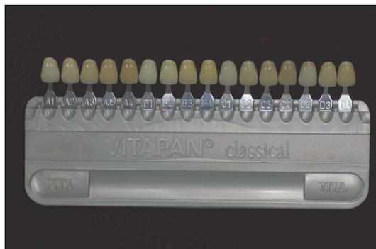
Fig. 1. The VITAPAN® classical shade guide (Vita Zahnfabrik, Bad Säckingen, Germany).

광원에 따른 육안과 기계를 이용한 치아 색조 관찰 시 정확성을 비교하기 위한 실험으로 맑은 날 09:00-10:00 사이의 오전, 12:00-13:00 사이의 정오, 16:00-17:00 사이의 오후에 1명의 검사자가 10명의 피검자를 육안, 기계 측정을 통해 색조를 선택하였다. 육안 평가는 각 3회의 측정을 통하여 최빈치의 원칙을 적용해 Vita classic shade 대표