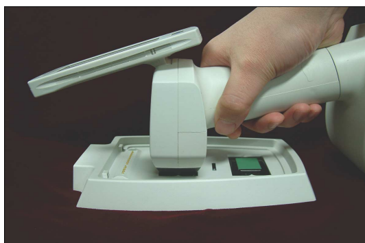
Fig. 3. Calibration process.