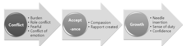
Figure 2. Conditional matrix.

소진감과 관련된 시간경과에 따른 변화는 3단계로 분류하여 ‘갈등기’, ‘수용기’, ‘성장기’로 구분하였다(Figure 2).