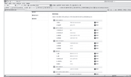
Figure 3-8. Music therapy real audio.