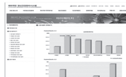
Figure 3-11. My page database.