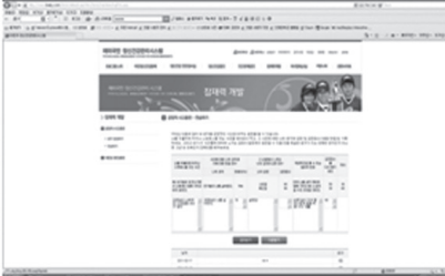
Figure 3-9. Positive thinking training.