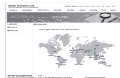
Figure 3-10. Community network