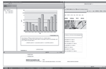
Figure 3-5. Results feedback page.