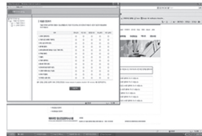
Figure 3-4. Expert diagnostic page.