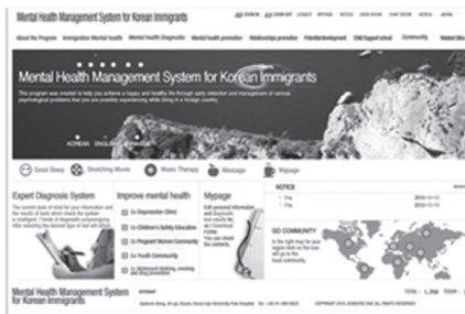
Figure 3-2. English main page.