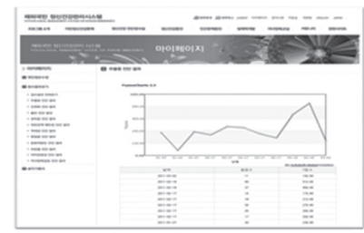
Figure 3-12. My page flow chart.