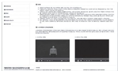
Figure 3-7. Exercise &amp; stretching page.