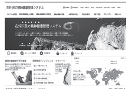
Figure 3-3. Japanese main page.