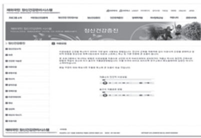
Figure 3-6. Relaxation method page.