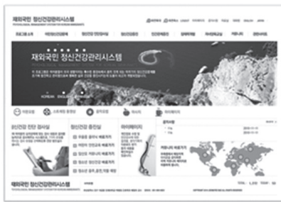
Figure 3-1. Korean main page.