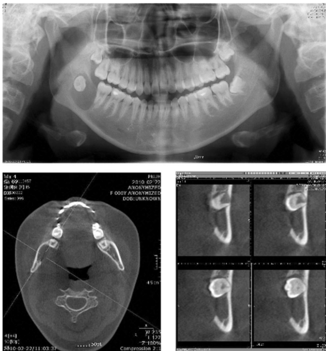
Fig. 1. Preoperative X-ray.

단방성 범랑모세포종의 기원에 대해서 이전부터 많은 연구가 있었다. Cahn 8 이 1933년 낭종이라고 명명되는 많은 수의 병소가 조직검사를 통하여 범랑모세포종임을 발견하고 함치성낭이 범랑모세포종으로 변할 수 있는 잠재력을 가지고 있다고 보고한 이래 9 함치성낭과 범랑모세포종의 연관성에 대한 많은 연구를 진행하였다. Robinson과 Martinez 3 는 치성 낭종과 범랑모세포종이 비슷한 일반적 발생과정을 가지기 때문에 비종양성 낭종이 신생물로 변화하는 것이 가능하다고 하였다. Leider 등 10 은 단방성 범랑모