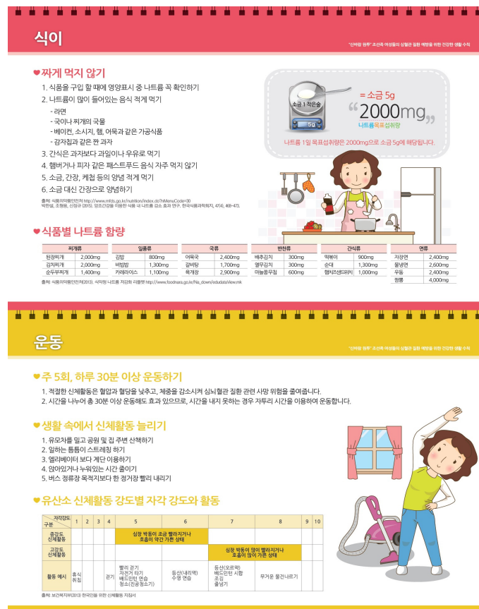
Figure 2. Examples of education materials.

요구도 조사를 바탕으로 건강증진 생활양식의 교육자료는 조선족 중년여성 근로자들의 심혈관계 질환 예방에 초점을 두어 개발하였다. 교육자료가 조선족 중년여성 근로자에게 효과적으로 적용되기 위한 적용 및 수행계획으로 월별로 심혈관계 질환 예방을 위한 실천 전략을 그림과 같이 제시하였다(Figure 2). 심혈관질환 예방을 위한 건강증진 생활양식의 교육내용은 문헌고찰과 요구도 조사 결과를 반영하여 건강증진 생활습관,