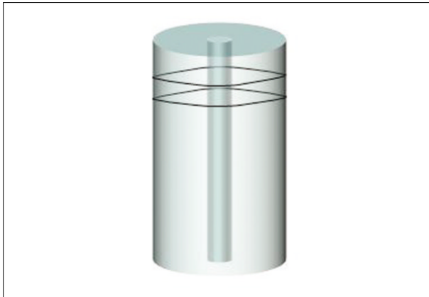
Figure 1. Schematic drawing of moulds.

로 포스트에서 경사가 없는 부위의 2 mm 두께 시편을 만들었으며(Figure 1), 시편을 절단할 때에는 각 포스트에서 평행한 부분을 절단하여 FRC-포스트의 경사진 부분을 배제하였다.